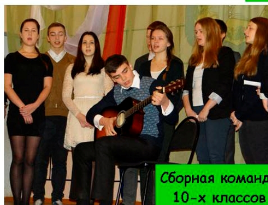
Сборная команда 10-х классов