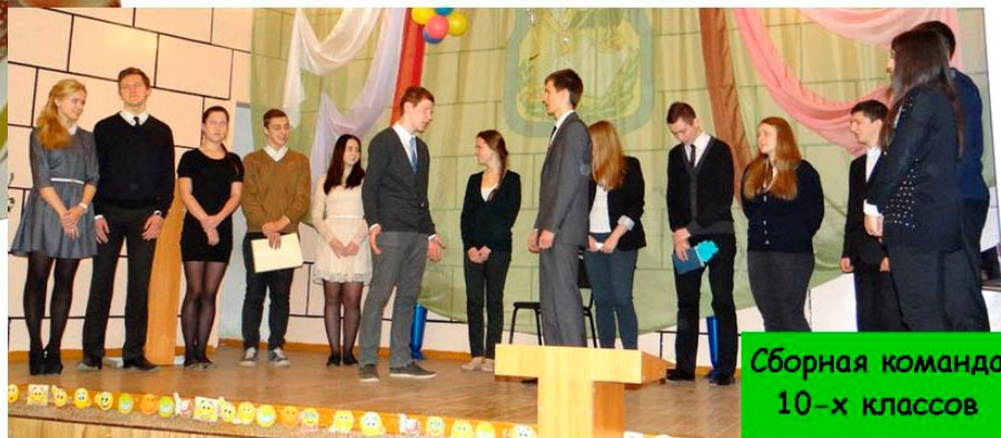
Сборная команда 10-х классов