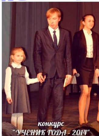
конкурс "УЧЕНИК ГОДА - 2014"